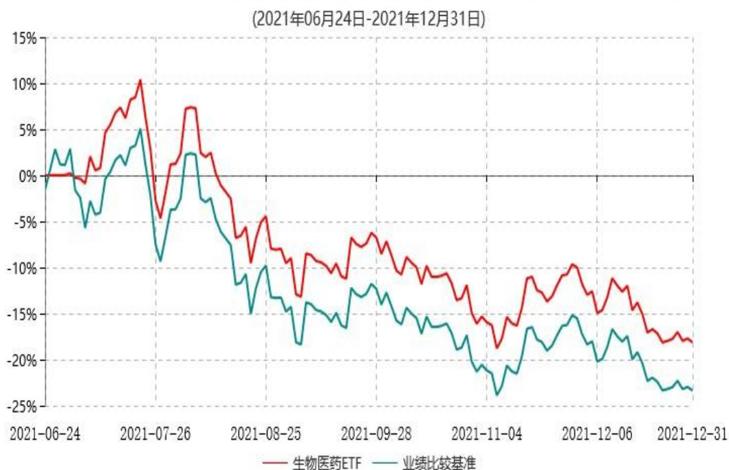
天弘国证生物医药交易型开放式指数证券投资基金累计净值增长率与业绩比较基准收益率历史走势对比图

注：1、本基金合同于2021年06月24日生效，本基金合同生效起至披露时点不满1年。