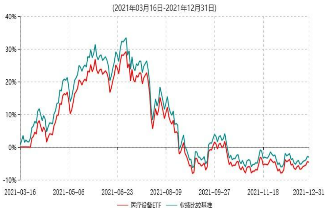
天弘中证全指医疗保健设备与服务交易型开放式指数证券投资基金累计净值增长率与业绩比较基准收益率历史走势对比图