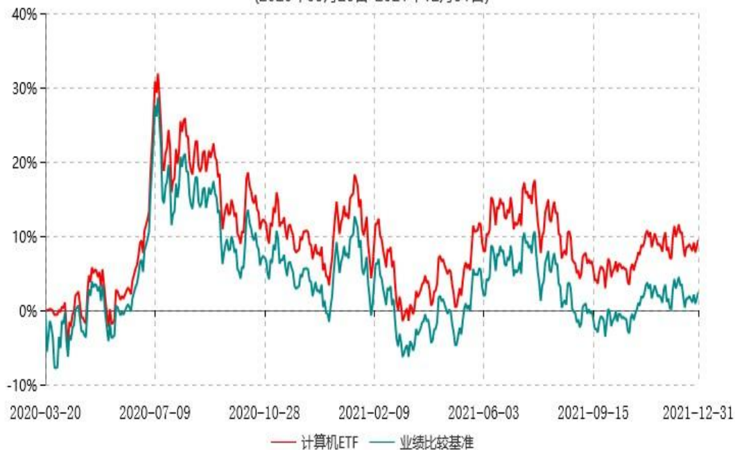
天弘中证计算机主题交易型开放式指数证券投资基金累计净值增长率与业绩比较基准收益率历史走势对比图 (2020年03月20日-2021年12月31日)