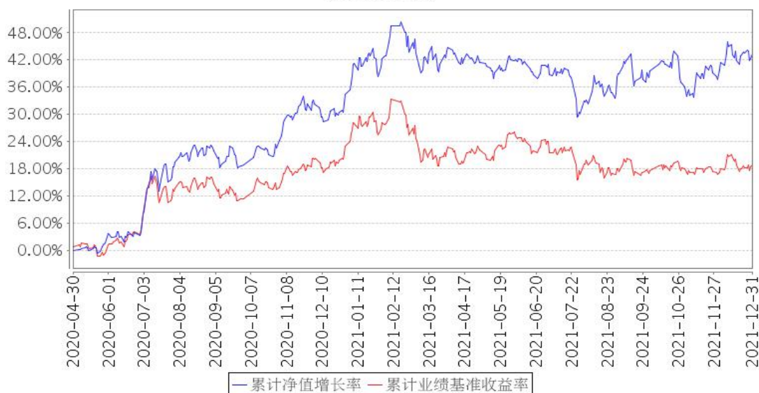
安信价值发现两年定开混合(LOF)累计净值增长率与同期业绩比较基准收益率的历史走势对比图