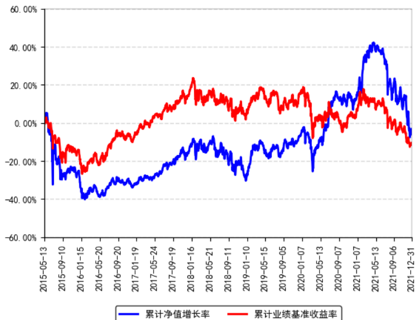
南方香港优选股票（QDII-LOF）累计净值增长率与同期业绩比较基准收益率的历史走势对比图