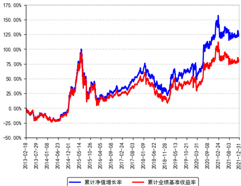
南方沪深300ETF累计净值增长率与同期业绩比较基准收益率的历史走势对比图