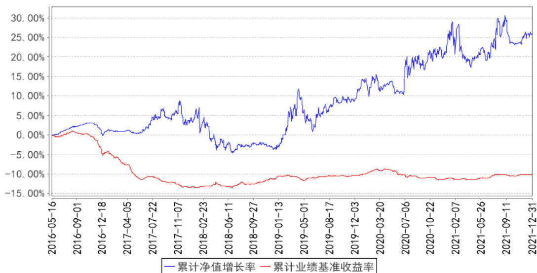
泰达宏利聚利债券（LOF）累计净值增长率与同期业绩比较基准收益率的历史走势对比图

注：本基金在建仓期结束时及截止报告期末各项投资比例已达到基金合同规定的比例要求。