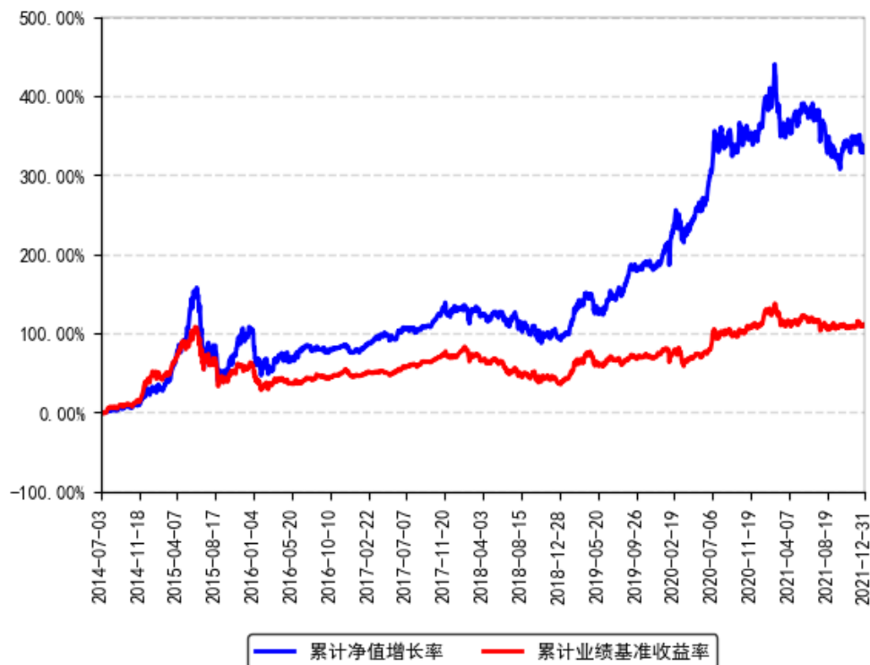
南方天元新产业股票累计净值增长率与同期业绩比较基准收益率的历史走势对比图