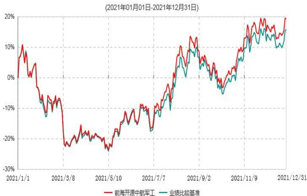
前海开源中航军工指数型证券投资基金累计净值增长率与业绩比较基准收益率历史走势对比图

注：①2021年1月1日（含当日）起，本基金转型为“前海开源中航军工指数型证券投资基金”。