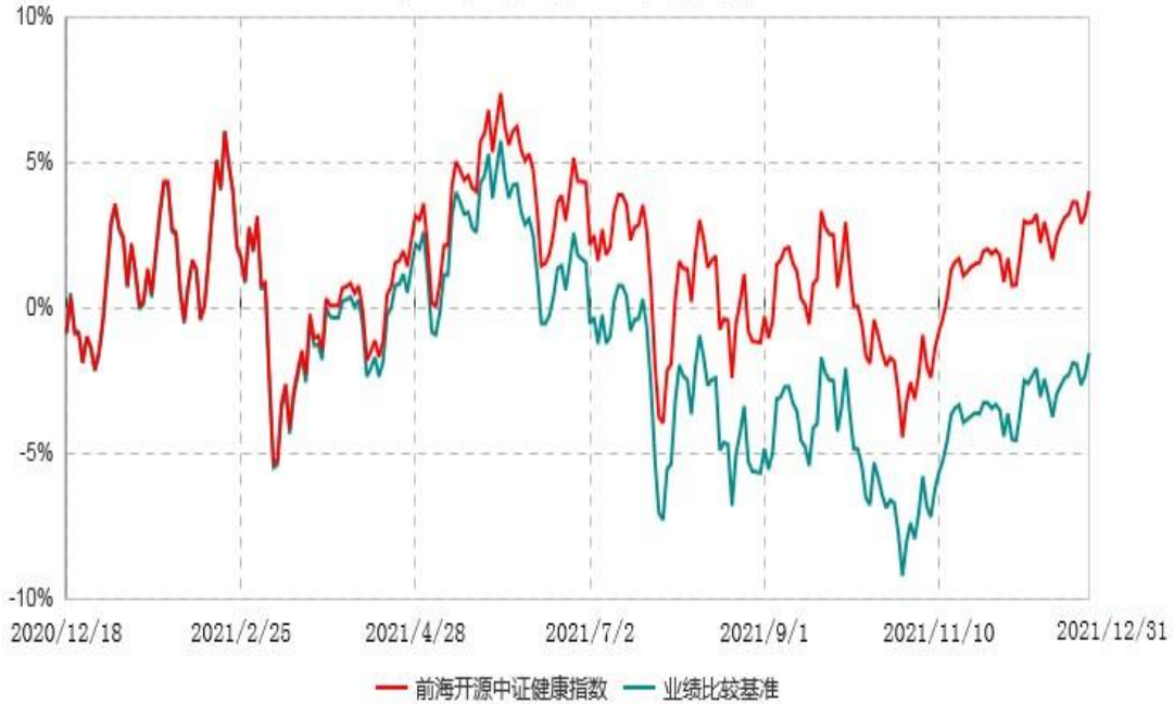
前海开源中证健康产业指数型证券投资基金累计净值增长率与业绩比较基准收益率历史走势对比图 (2020年12月18日-2021年12月31日)

注：①2020年12月18日(含当日)起, 本基金转型为“前海开源中证健康产业指数型证券投资基金”。