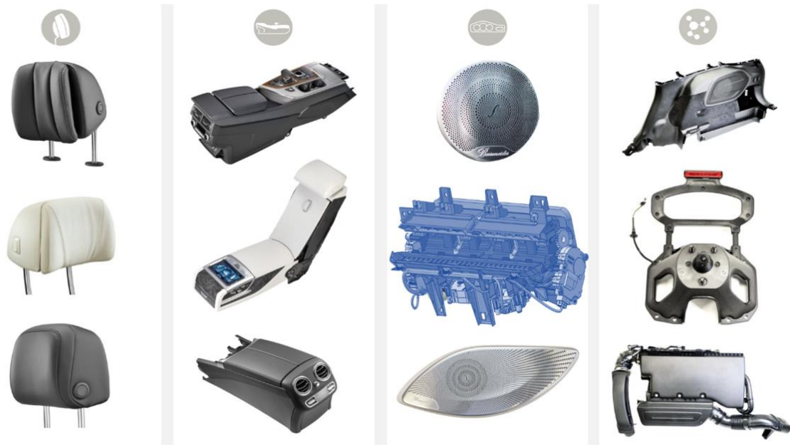
乘用车内饰件产品

户提供深度定制化的产品及解决方案，持续引领乘用车座椅头枕、扶手、中控系统等乘用车内饰件市场。