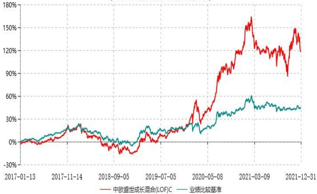
中欧盛世成长混合(LOF)C累计净值增长率与业绩比较基准收益率历史走势对比图 (2017年01月13日-2021年12月31日)

注：本基金于2017年1月12日新增C类份额，图示日期为2017年1月13日至2021年12月31日。