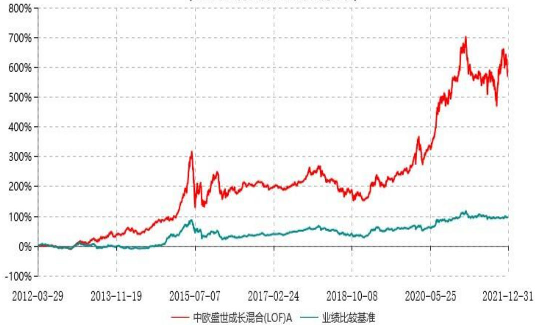
中欧盛世成长混合(LOF)A累计净值增长率与业绩比较基准收益率历史走势对比图 (2012年03月29日-2021年12月31日)