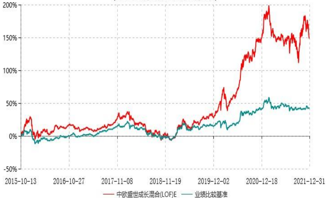
中欧盛世成长混合(LOF)E累计净值增长率与业绩比较基准收益率历史走势对比图 (2015年10月13日-2021年12月31日)

注：本基金于 2015 年 10 月 8 日新增 E 份额，图示日期为 2015 年 10 月 13 日至 2021 年 12 月 31 日。