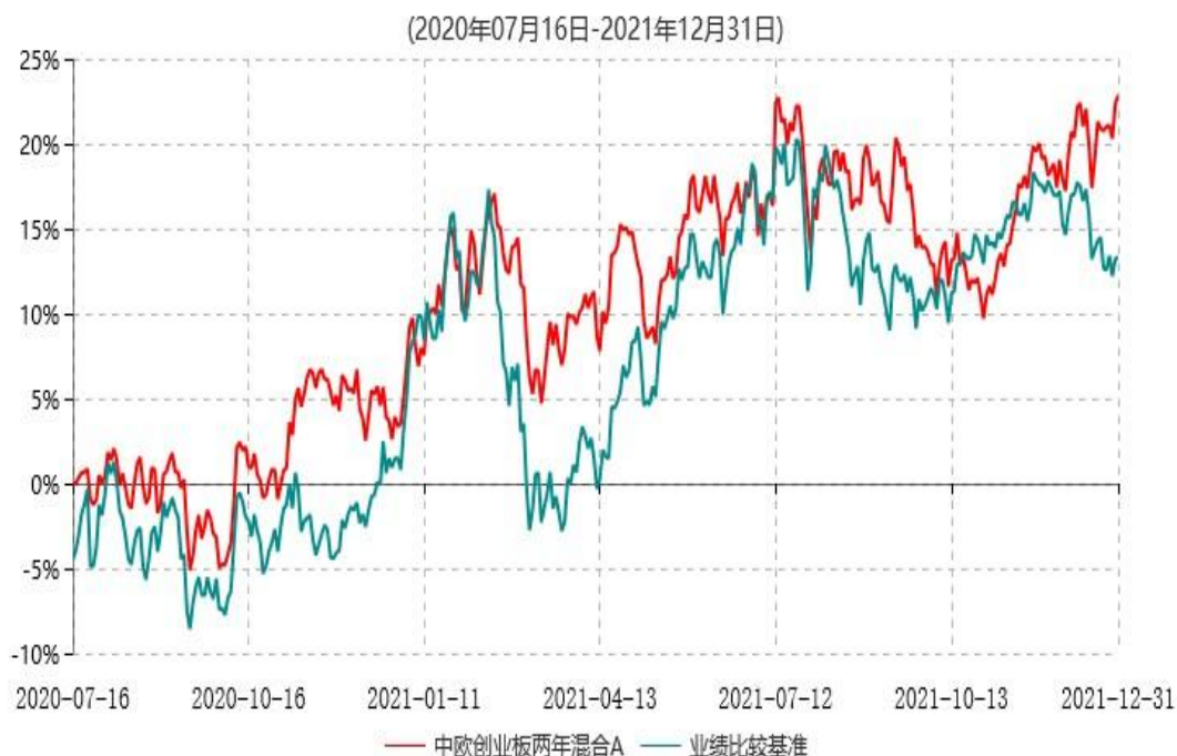
中欧创业板两年混合A累计净值增长率与业绩比较基准收益率历史走势对比图

注：本基金基金合同生效日期为 2020 年 7 月 16 日，按基金合同的规定，本基金自基金合同生效起六个月为建仓期，建仓期结束时各项资产配置比例已符合基金合同约定。