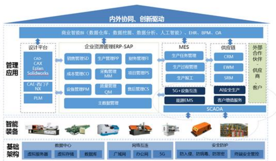
科达数字工厂方案规划

全面采集、高效互通，助力企业价值链攀升，在产业链及相似行业纬度发挥示范与价值共创作用，推动行业高质量发展。