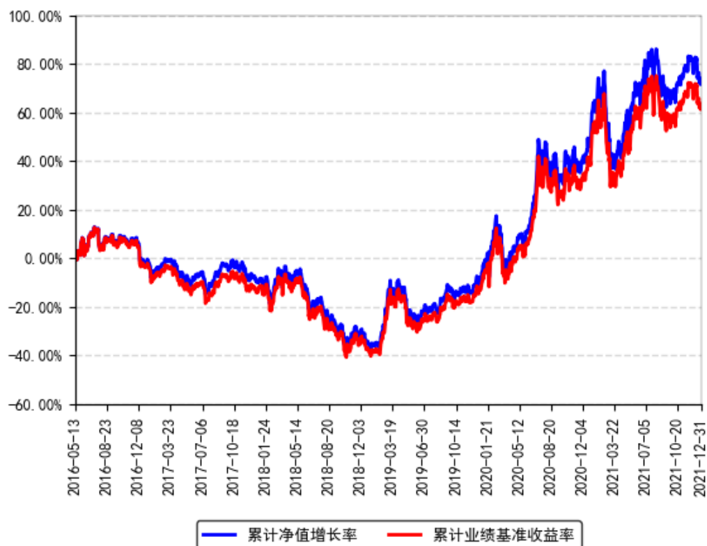
南方创业板ETF累计净值增长率与同期业绩比较基准收益率的历史走势对比图