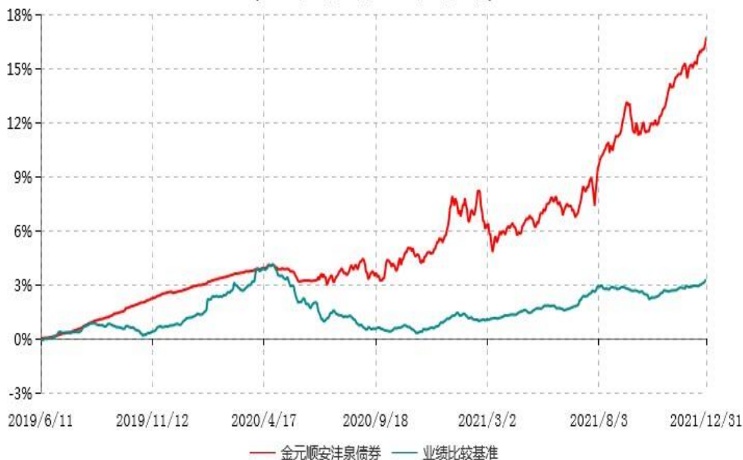
金元顺安沅泉债券型证券投资基金累计净值增长率与业绩比较基准收益率历史走势对比图 (2019年06月10日-2021年12月31日)