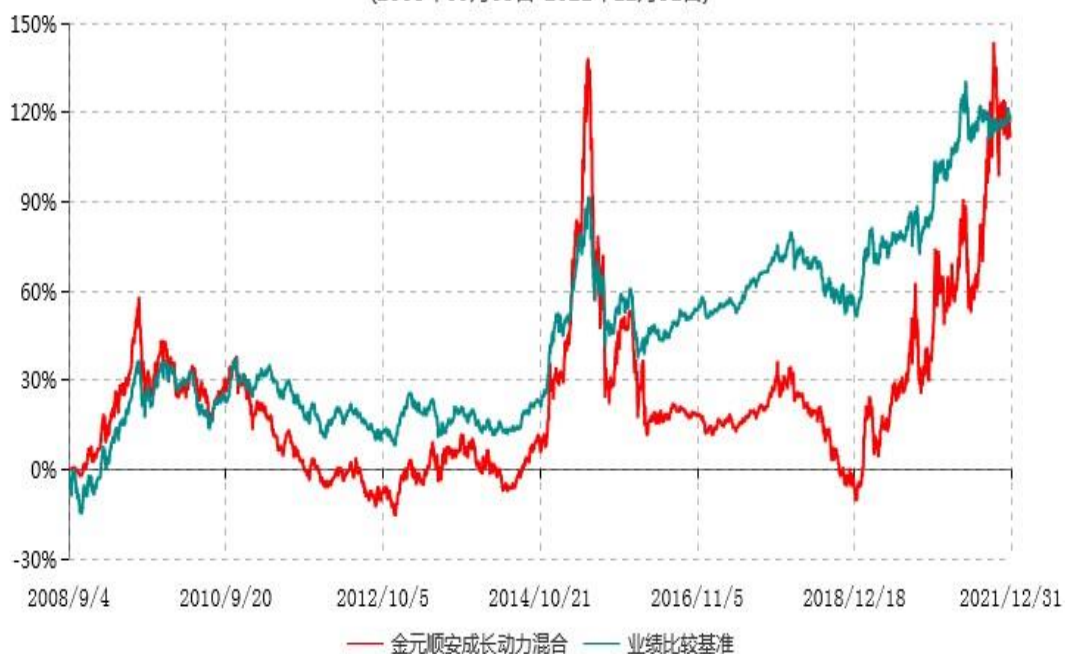
金元顺安成长动力灵活配置混合型证券投资基金累计净值增长率与业绩比较基准收益率历史走势对比图 (2008年09月03日-2021年12月31日)