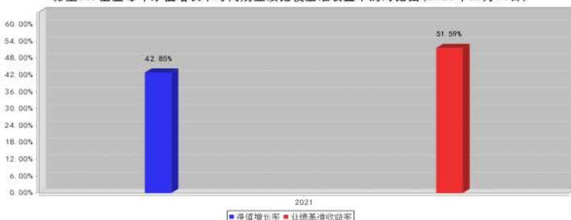
稀土ETF基金每年净值增长率与同期业绩比较基准收益率的对比图(2021年12月31日)

注:业绩表现截止日期 2021 年 12 月 31 日。基金过往业绩不代表未来表现。