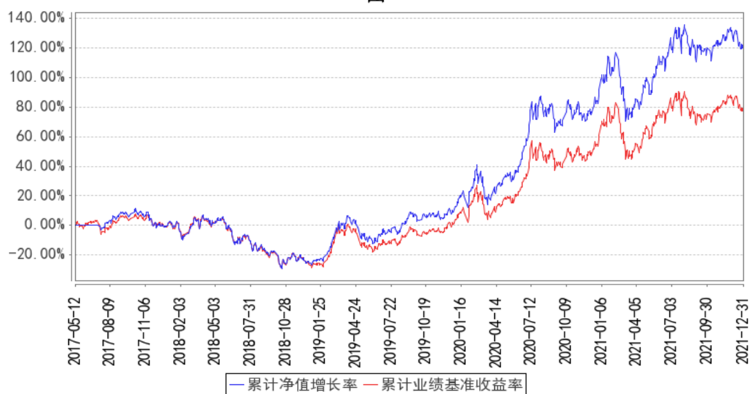
华泰柏瑞量化创优累计净值增长率与同期业绩比较基准收益率的历史走势对比图

注：图示日期为 2017 年 5 月 12 日至 2021 年 12 月 31 日。