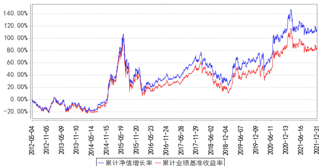
华泰柏瑞沪深300ETF累计净值增长率与同期业绩比较基准收益率的历史走势对比图

注：图示日期为 2012 年 5 月 4 日至 2021 年 12 月 31 日。