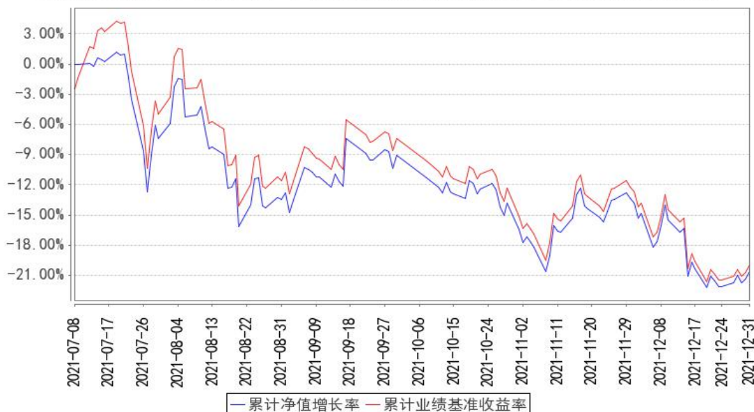
创新药50累计净值增长率与同期业绩比较基准收益率的历史走势对比图