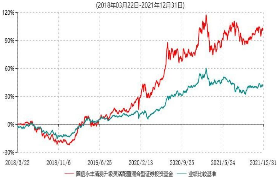
圆信永丰消费升级灵活配置混合型证券投资基金累计净值增长率与业绩比较基准收益率历史走势对比图