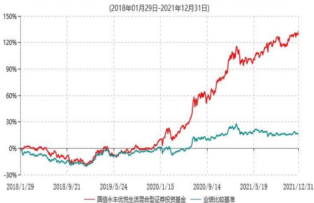
圆信永丰优悦生活混合型证券投资基金累计净值增长率与业绩比较基准收益率历史走势对比图