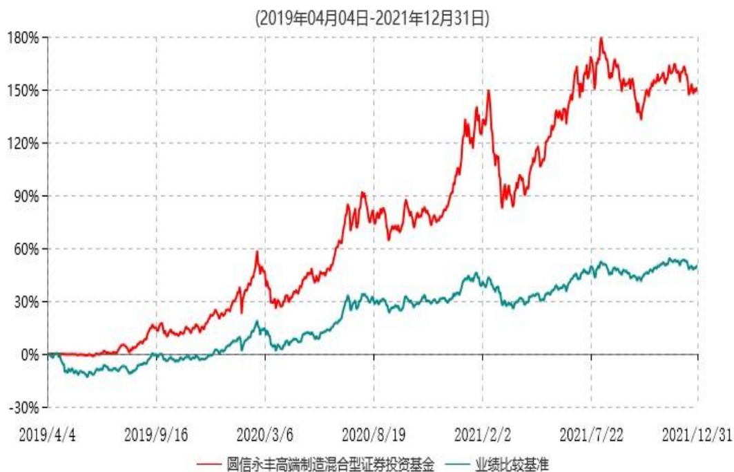
圆信永丰高端制造混合型证券投资基金累计净值增长率与业绩比较基准收益率历史走势对比图