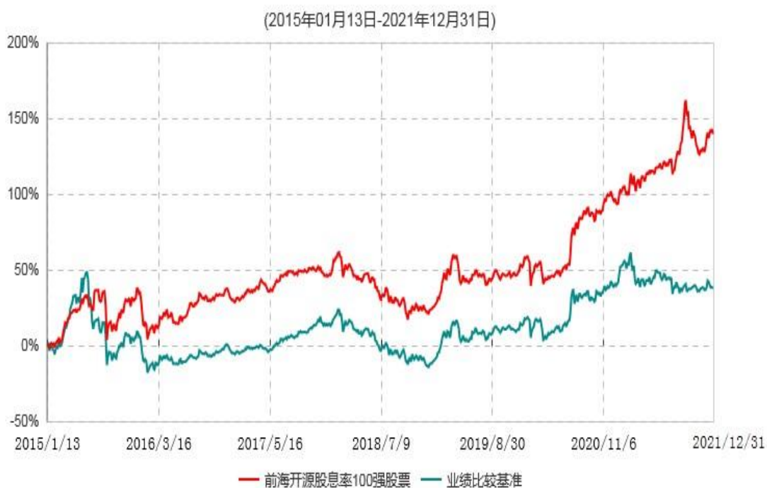
前海开源股息率100强等权重股票型证券投资基金累计净值增长率与业绩比较基准收益率历史走势对比图