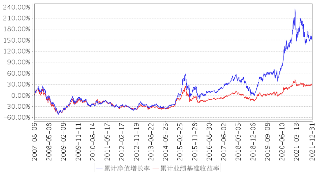
长城品牌优选混合累计净值增长率与同期业绩比较基准收益率的历史走势对比图

注：本基金合同规定本基金投资组合的资产配置为：股票资产 60%—95%，权证投资 0%—3%，债券 0%—35%，本基金保持不低于基金资产净值 5%的现金或者到期日在一年以内的政府债券，其中，现金类资产不包括结算备付金、存出保证金、应收申购款。本基金的股票投资主要集中在具有优势品牌并有成长空间的企业、有潜力成为优势品牌的企业及品牌延伸型企业等三类具备品牌优势的上市公司，投资于具备品牌优势的上市公司的比例不低于本基金股票资产的 80%。本基金的建仓期为自本基金基金合同生效日起 6 个月，建仓期满时，各项资产配置比例符合基金合同约定。