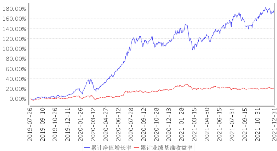
长城久鼎混合累计净值增长率与同期业绩比较基准收益率的历史走势对比图

注：①本基金合同规定本基金股票等权益类投资占基金资产的比例范围为 0-95%，债券等固定收益类投资占基金资产的比例范围为 0-95%；现金或者到期日在 1 年以内的政府债券不低于基金资产净值的 5%，其中，现金类资产不包括结算备付金、存出保证金、应收申购款。