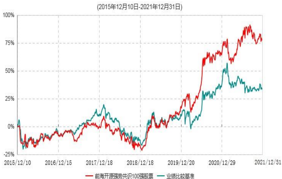
前海开源强势共识100强等权重股票型证券投资基金累计净值增长率与业绩比较基准收益率历史走势对比图