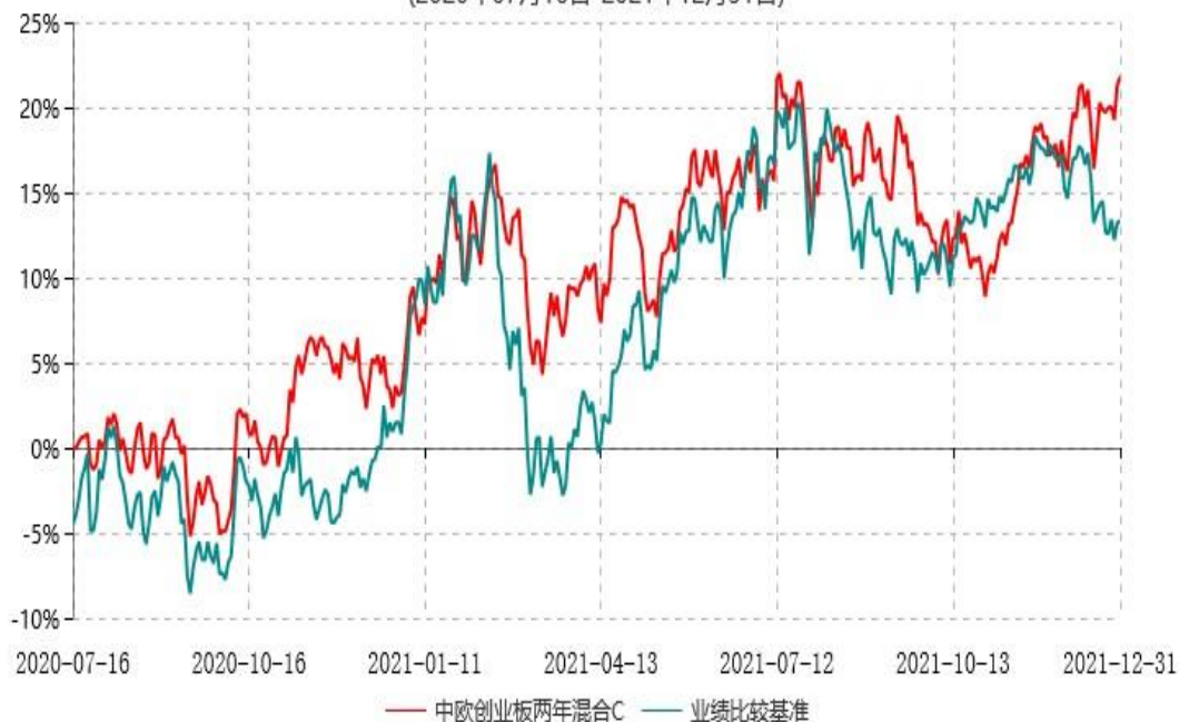
中欧创业板两年混合C累计净值增长率与业绩比较基准收益率历史走势对比图 (2020年07月16日-2021年12月31日)

注：本基金基金合同生效日期为 2020 年 7 月 16 日，按基金合同的规定，本基金自基金合同生效起六个月为建仓期，建仓期结束时各项资产配置比例已符合基金合同约定。