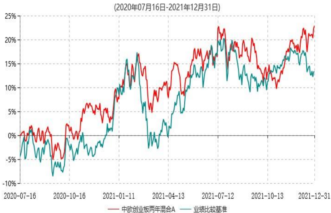
中欧创业板两年混合A累计净值增长率与业绩比较基准收益率历史走势对比图

注：本基金基金合同生效日期为 2020 年 7 月 16 日，按基金合同的规定，本基金自基金合同生效起六个月为建仓期，建仓期结束时各项资产配置比例已符合基金合同约定。