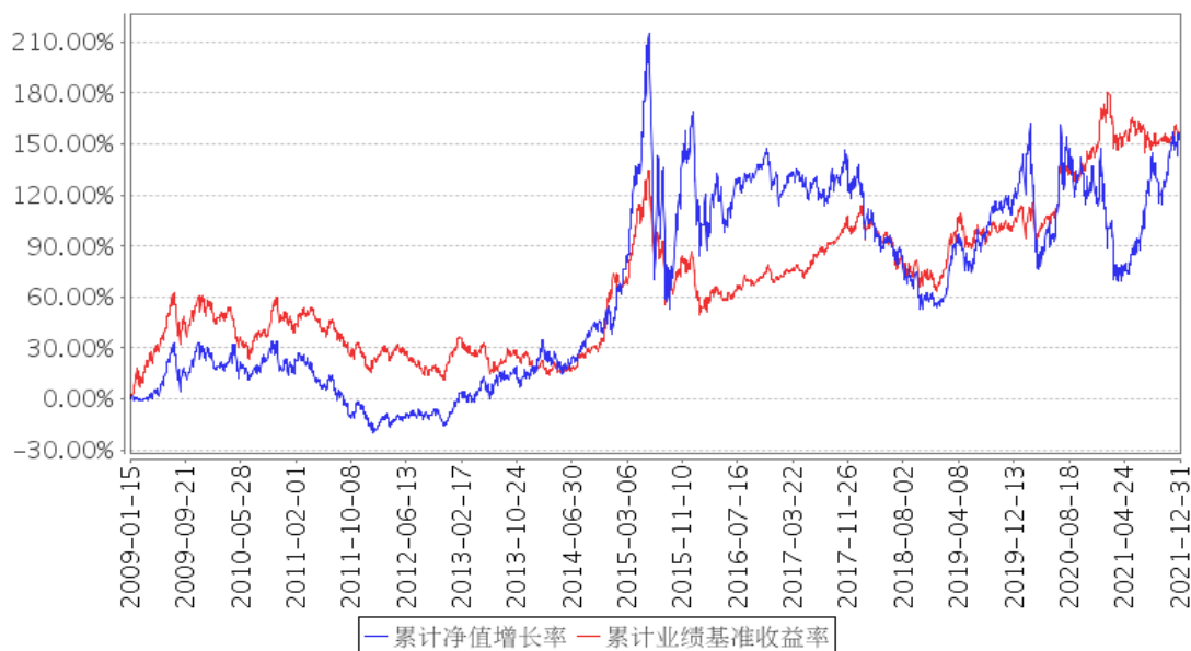
长城双动力混合累计净值增长率与同期业绩比较基准收益率的历史走势对比图

注：本基金合同规定本基金的投资组合比例为：股票资产占基金资产 60%—95%，权证投资占基金资产 0%—3%，债券占基金资产 0%—35%，本基金保持不低于基金资产净值 5%的现金或者到期日在一年以内的政府债券，其中，现金类资产不包括结算备付金、存出保证金、应收申购款。本基金的建仓期为自本基金基金合同生效日起 6 个月，建仓期满时，各项资产配置比例符合基金合同约定。