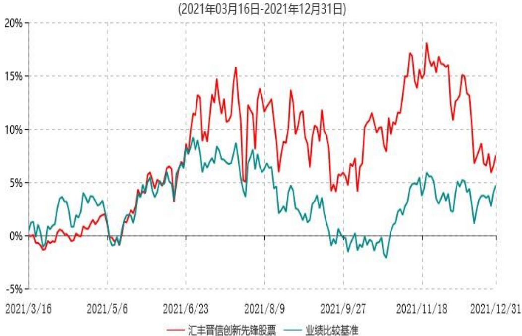
汇丰晋信创新先锋股票型证券投资基金累计净值增长率与业绩比较基准收益率历史走势对比图