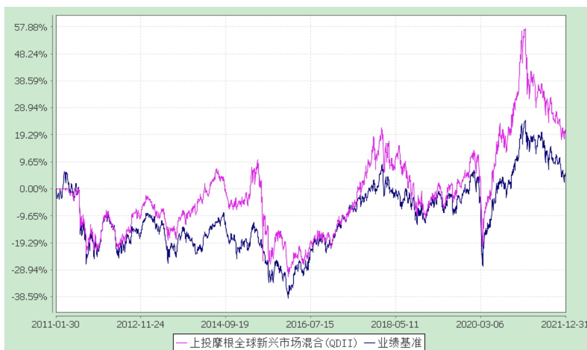
上投摩根全球新兴市场混合型证券投资基金 自基金合同生效以来份额累计净值增长率与业绩比较基准收益率历史走势对比图 (2011 年 1 月 30 日至 2021 年 12 月 31 日)

注：本基金合同生效日为 2011 年 1 月 30 日，图示的时间段为合同生效日至本报告期末。