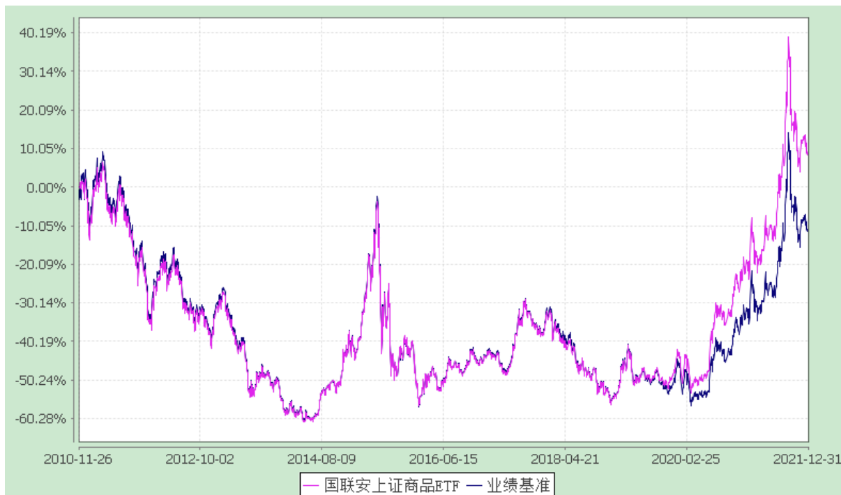
自基金合同生效以来份额累计净值增长率与业绩比较基准收益率的历史走势对比图 (2010 年 11 月 26 日至 2021 年 12 月 31 日)