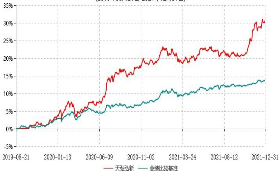
天弘弘新混合型发起式证券投资基金累计净值增长率与业绩比较基准收益率历史走势对比图 (2019年08月21日-2021年12月31日)