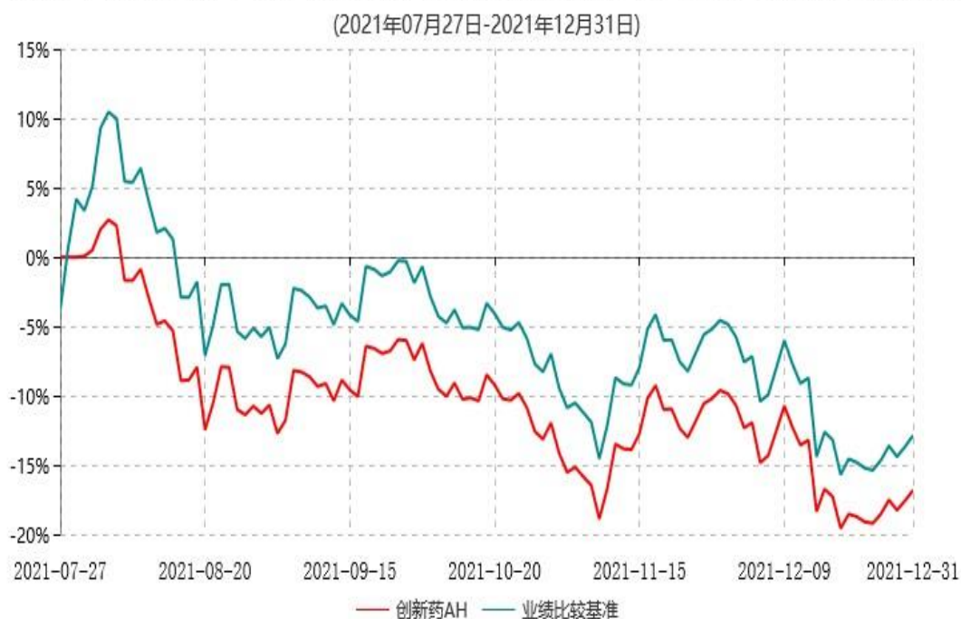
天弘恒生沪深港创新药精选50交易型开放式指数证券投资基金累计净值增长率与业绩比较基准收益率历史走势对比图

注：1、本基金合同于2021年07月27日生效，本基金合同生效起至披露时点不满1年。