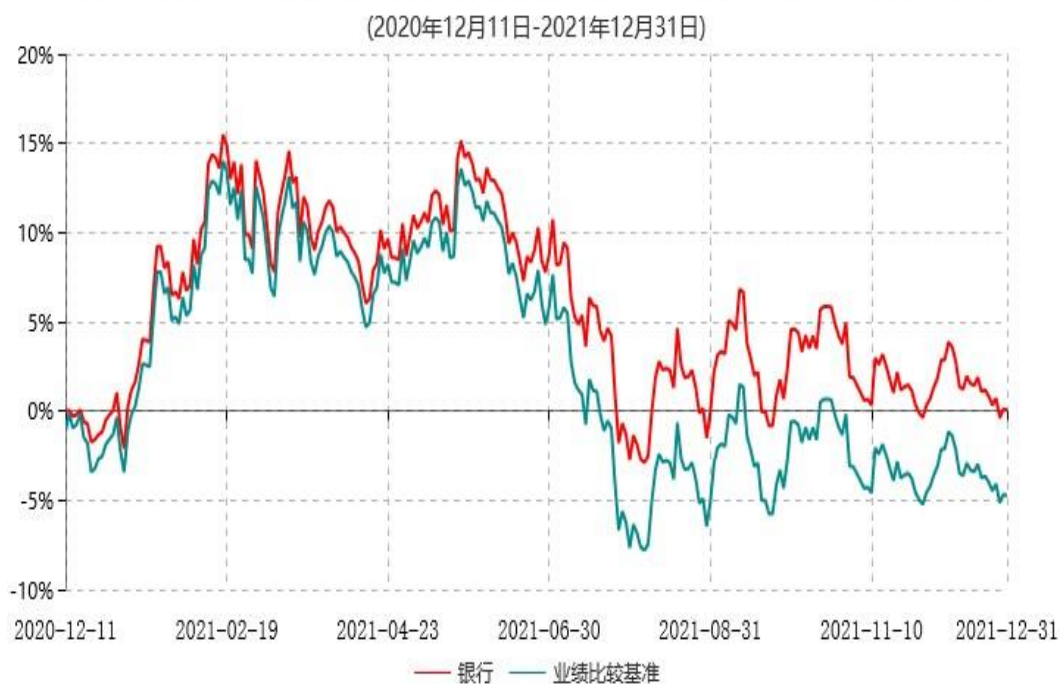
天弘中证银行交易型开放式指数证券投资基金累计净值增长率与业绩比较基准收益率历史走势对比图