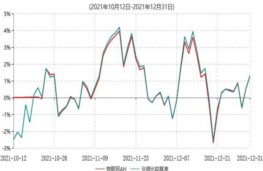
天弘中证沪港深物联网主题交易型开放式指数证券投资基金累计净值增长率与业绩比较基准收益率历史走势对比图

注：1、本基金合同于2021年10月12日生效，本基金合同生效起至披露时点不满1年。