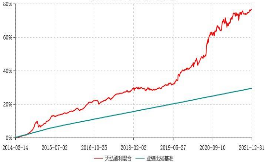
天弘通利混合型证券投资基金累计净值增长率与业绩比较基准收益率历史走势对比图 (2014年03月14日-2021年12月31日)