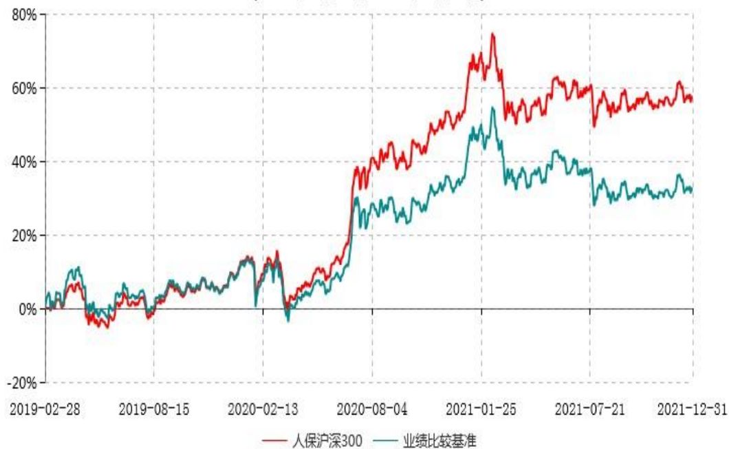
人保沪深300指数型证券投资基金累计净值增长率与业绩比较基准收益率历史走势对比图 (2019年02月28日-2021年12月31日)

注：1、本基金基金合同于2019年2月28日生效。根据基金合同规定，本基金建仓期为6个月，建仓期满，本基金的各项投资比例应符合基金合同的有关约定。