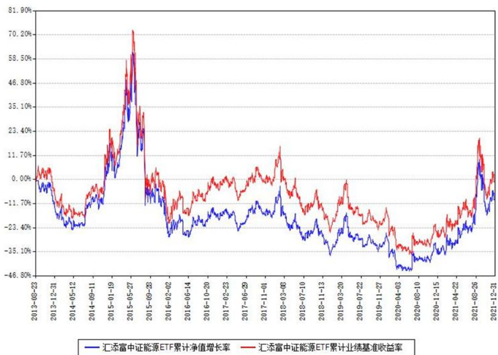
汇添富中证能源ETF累计净值增长率与同期业绩基准收益率对比图