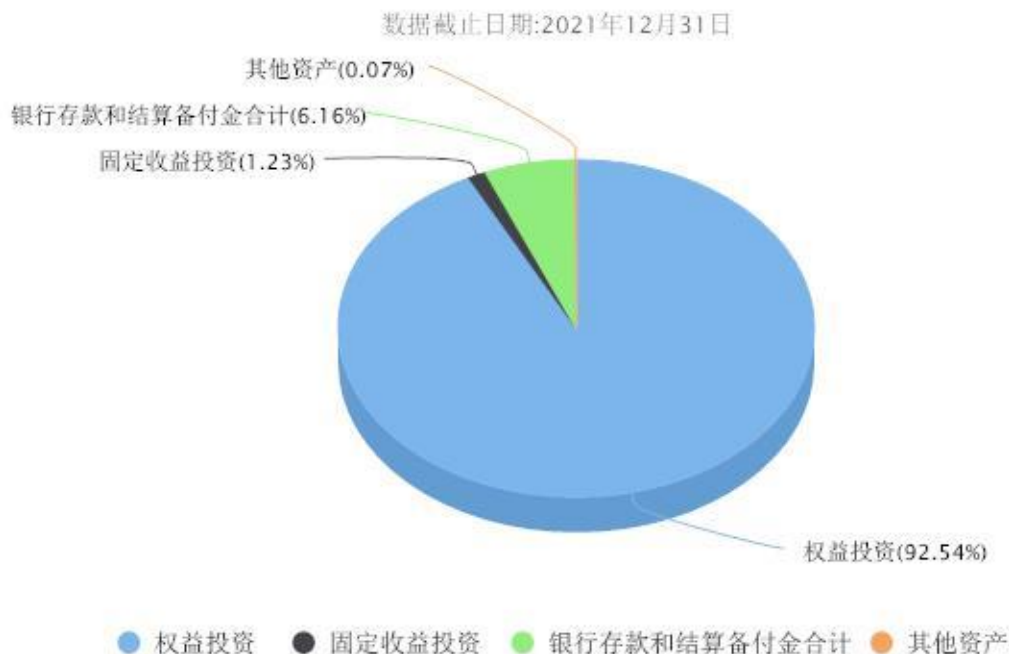
汇添富沪深300基本面增强指数A投资组合资产配置图表