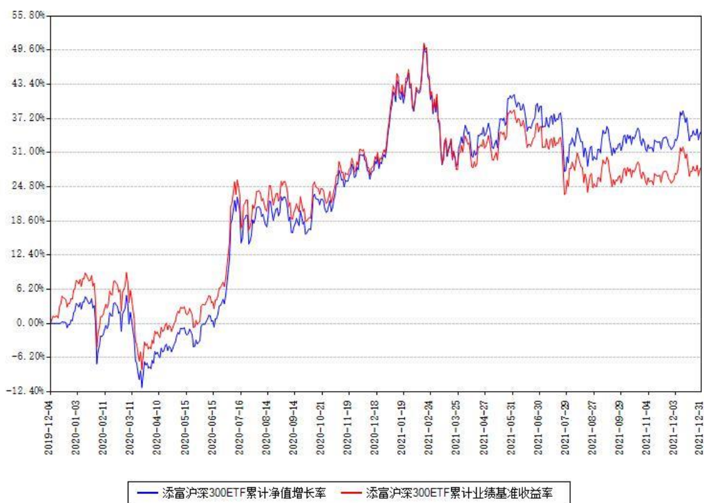
添富沪深300ETF累计净值增长率与同期业绩基准收益率对比图

(二) 自基金合同生效以来基金累计净值增长率变动及其与同期业绩比较基准收益率变动的比较图