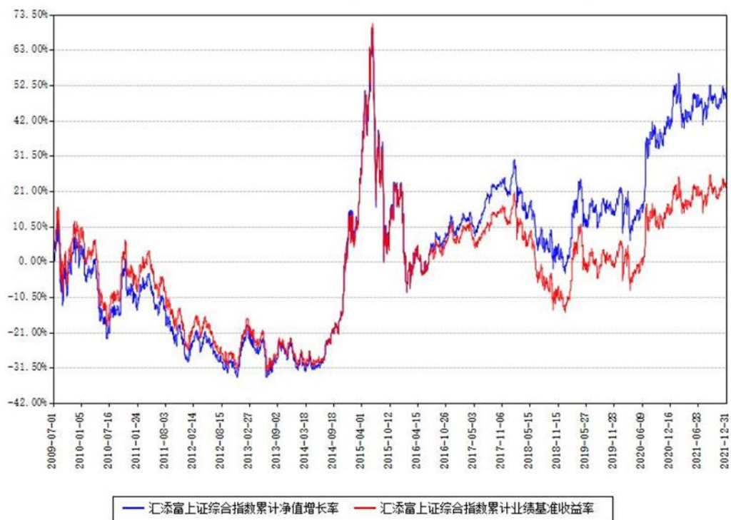
汇添富上证综合指数累计净值增长率与同期业绩基准收益率对比图