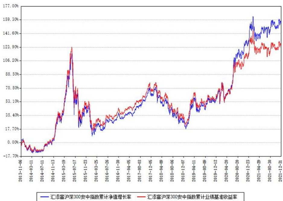
汇添富沪深300安中指数累计净值增长率与同期业绩基准收益率对比图