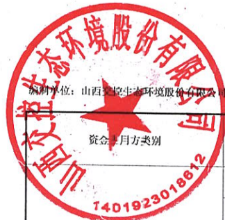
控股股东、实际控制人及其关联方资金占用情况汇总表