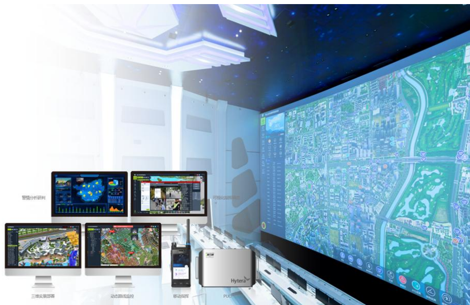
指挥调度平台产品族

在海外建立了市、州级别ICC指调项目的国际竞争力。公司通过指挥调度业务打通行业客户监测、研判、指挥、行动和监督的事件处置全流程，增强客户粘性，进一步带动系统和终端产品销售。