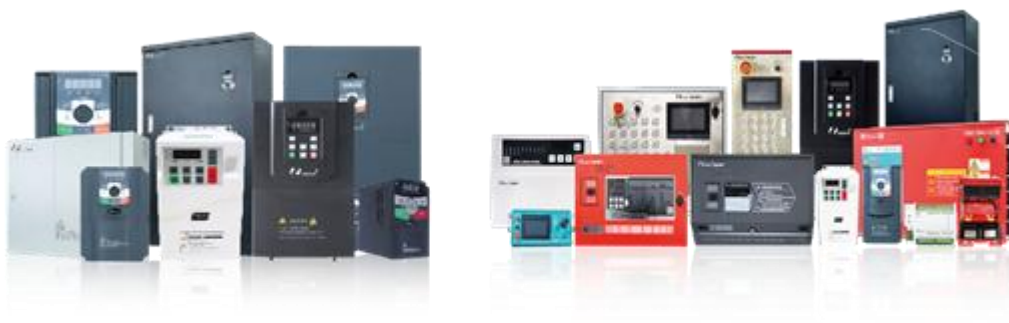
图2 低压变频器系列

2021年，公司低压变频器产品全年实现销售收入25,761.39万元，同比增长22.40%。2022年公司将持续加大研发投入，引进高端研发人员，完善研发测试设备，借力集团研发资源，提升产品竞争力。营销端，公司将继续拓展通用低压变频器市场，充分挖掘现有市场潜力，同时大力开拓其他行业专机市场，重点着力于注塑、暖通、冲床等行业。公司将优化全价值链，实施精细化管理，促使低压变频器业务快速进入国产品牌的前列，加速推进低压变频器行业进口替代的进程。