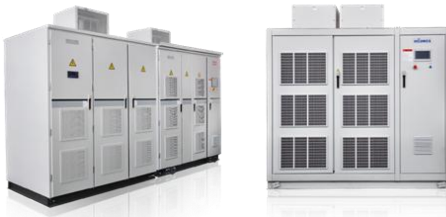
图1 高压变频器系列

2021年，中高压变频器市场高速增长，公司作为高压变频器行业的龙头企业，2021年依然保持市场领先地位，高压变频器收入稳步上升。同时公司积极开拓海外市场，韩国和德国的集成商客户实现订单转化，海外高压变频器市场取得较大突破。报告期内，高压变频器收入72,195.93万元，同比增长32.23%。高压变频器新增订单金额65,906.13万元，同比增长15.38%。公司将加强研发投入，在保持技术领先优势的同时，加大国内各行业以及海外市场开拓力度，稳固公司的头部企业地位。