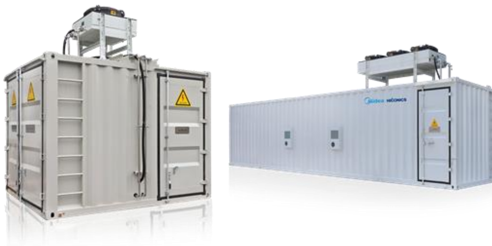
图3 高压无功动态补偿装置

公司生产的SVG主要应用于风电、光伏、冶金、矿山等领域。2021年12月，由公司自主研发生产的首台两套SVG动态无功补偿装置在陕西省吴起县60MW分散式风电项目中成功投运。