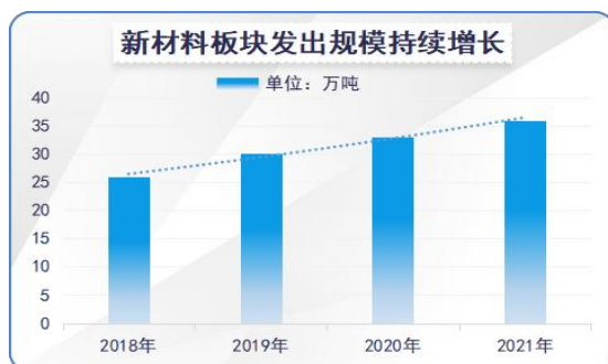
图2：新材料板块产品发出规模持续增长

报告期，万马高分子产业布局基本完成，杭州临安本部，清远、四川及湖州子公司一期项目均实现全面投产运行；超高压一期顺利投产达到项目预期，二期项目进展顺利。成功开发出220 kV超净绝缘料、110kV超光滑屏蔽料的开发、35kV聚丙烯电缆料等新产品。