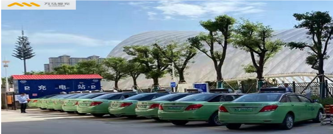
图4：万马爱充西安华夏幸福里充电站，2021年平均单桩日充电时长6.9小时

报告期，公司全国充电场站经营不同程度地受到疫情影响，公司采用“一城一策”的市场经营政策，开展卓有成效的市场恢复策略。全年实现充电量约4亿度，同比增长约43%；运营效率稳定，全国多个充电站月均充电时长超6小时（图4），成都、苏州、无锡、武汉、深圳等城市运营绩效突出。公司充电设备运行稳定，报告期，充电设备销售收入同比增长约41%。