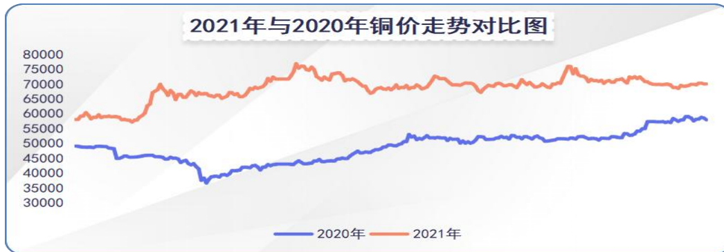
图1：近两年铜价走势对比

障高标准客户服务的实现。面对原材料价格大幅波动，公司继续完善套期保值管理，针对铜价高企导致的营运资金占用增加，公司及时调整经营策略，在接单、应收管理、供应链管理等方面多管齐下，提高运营效率。