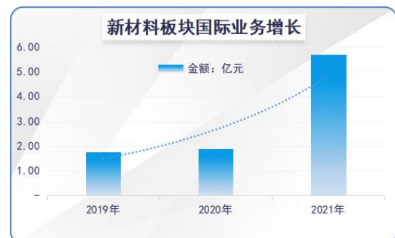
图3：新材料板块国际业务持续增长