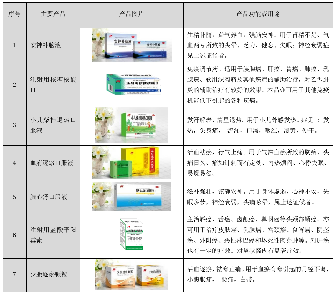
表 2：公司主要产品目录