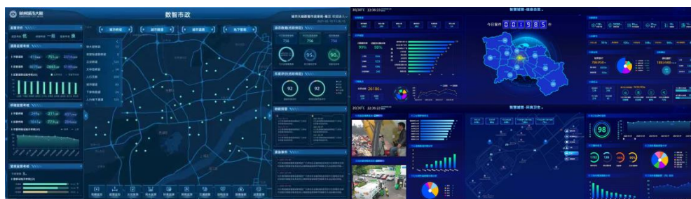
数智市政平台&amp;智慧城管平台

● 数字政府业务涵盖智慧监管、智慧城管、智慧公安、电子政务等领域，是以新一代信息技术为支撑，助力政府进一步优化调整内部组织架构、运作程序和管理服务，全面提升政府在经济调节、市场监管、社会治理、公共服务、环境保护等方面的履职能力。