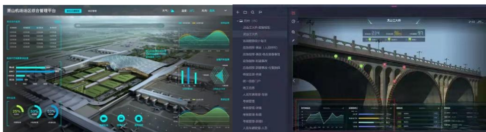
机场综合管理平台&amp;智慧桥梁安全监测

● 数字政府业务涵盖智慧监管、智慧城管、智慧公安、电子政务等领域，是以新一代信息技术为支撑，助力政府进一步优化调整内部组织架构、运作程序和管理服务，全面提升政府在经济调节、市场监管、社会治理、公共服务、环境保护等方面的履职能力。