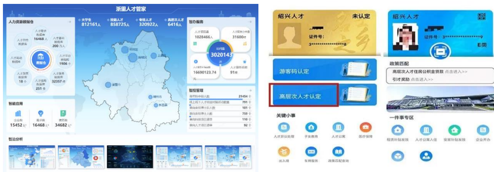
浙里人才管家&人才码