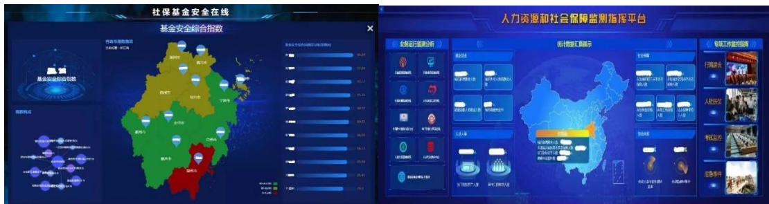
社保基金安全在线&人力资源和社会保障监测智慧平台

在智能民生领域，作为全国最早的社保及医保信息化服务提供商之一，公司不断深化拓展养老、社保、医疗等健康和民生保障业务，为其构建硬件和软件应用平台，提供信息系统开发、建设、运维等全面解决方案。业务涵盖智慧人社、智慧医保、劳动就业、人事人才、退役军人、智慧助残、健康大数据等方面，主要产品有社会保险管理省（市）集中、智慧医保管理与服务系统、就业管理与服务信息系统、国家及多地的农民工工资监管系统、劳动关系运行管理平台、大数据分析与服务平台、移动医疗支付等解决方案。