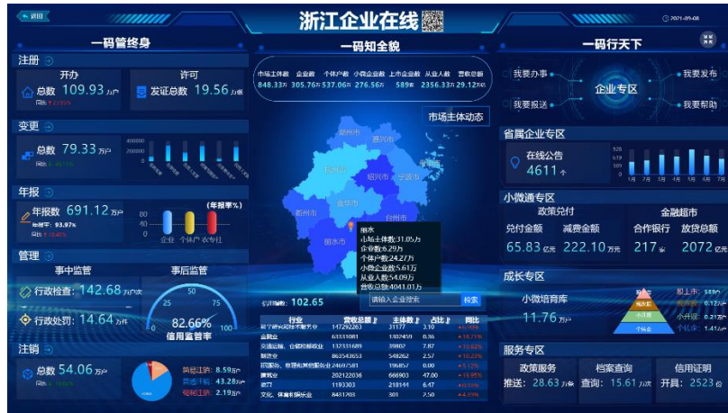
“浙江企业在线”政企互动平台

在智能民生领域，作为全国最早的社保及医保信息化服务提供商之一，公司不断深化拓展养老、社保、医疗等健康和民生保障业务，为其构建硬件和软件应用平台，提供信息系统开发、建设、运维等全面解决方案。业务涵盖智慧人社、智慧医保、劳动就业、人事人才、退役军人、智慧助残、健康大数据等方面，主要产品有社会保险管理省（市）集中、智慧医保管理与服务系统、就业管理与服务信息系统、国家及多地的农民工工资监管系统、劳动关系运行管理平台、大数据分析与服务平台、移动医疗支付等解决方案。